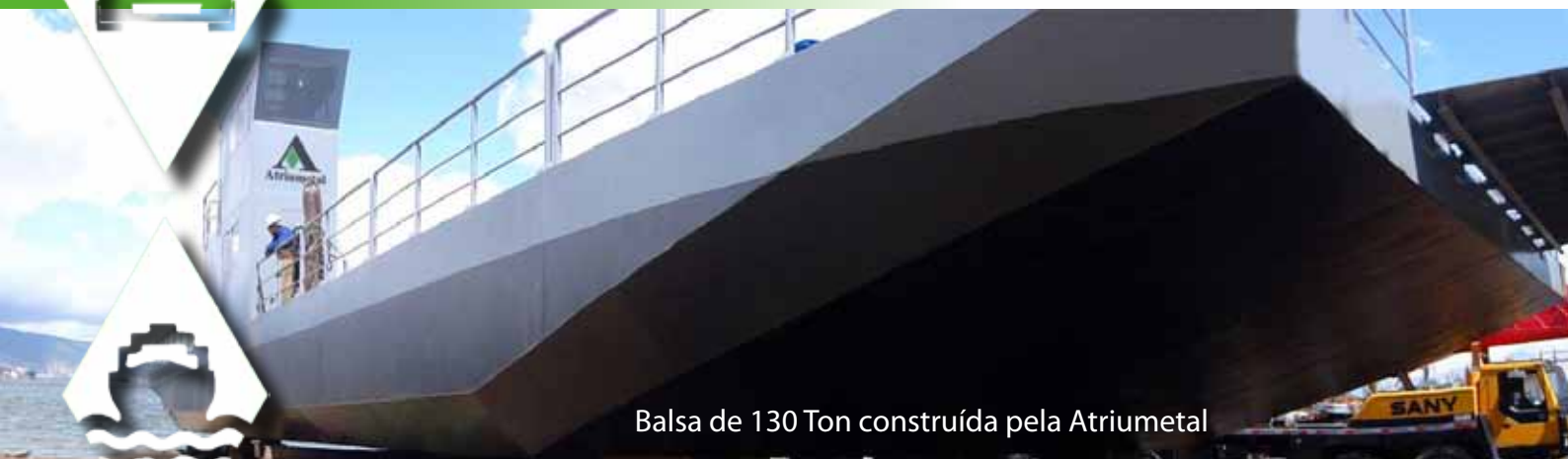
Balsa de 130 Ton construída pela Atriumetal